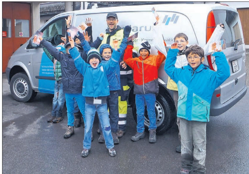
Der Glarners Ferien(s)pass 2015 bietet wieder eine Vielzahl verschiedener Kurse an.

In der ersten Anmeldephase haben sich bereits über 800 Kinder einen Platz beim Ferien(s)pass im Frühling gesichert. 120 Kurse sind voll belegt. Es besteht aber immer noch bei 90 spannenden Angeboten die Möglichkeit, sich zu registrieren.