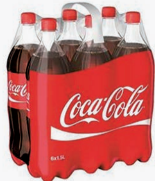
Coca Cola 1.5l PET, Schrumpfpack