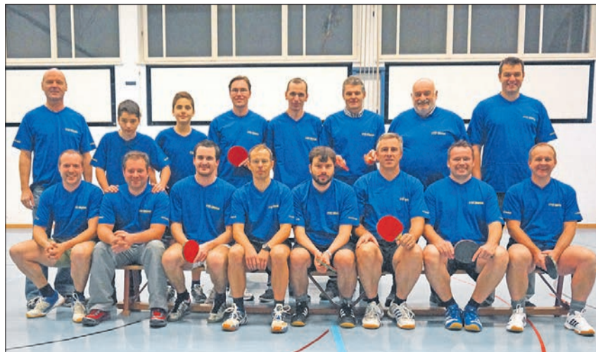
Die Spieler freuen sich über die neuen Shirts der Laager-Kunststoff AG.

Der Tischtennis-Club Glarus ist hochmotiviert mit neuen Shirts in die neue Saison 2014/15 gestartet.