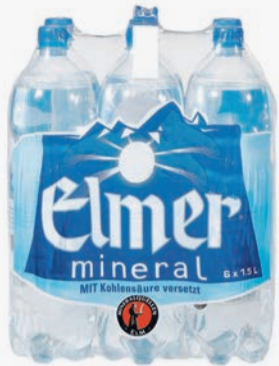
Elmer Mineral 1.5l PET, Schrumpfpack / Harass